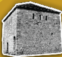
Hoqa e Madhe Velika Hoča