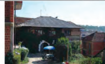
Pamje Perëndimore - Kulmi i mbuluar me pllakë Sallonit