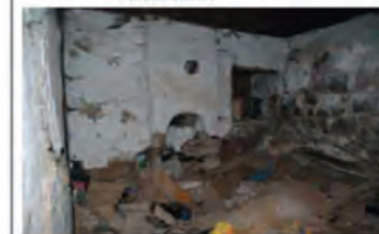
OXHAKU i vjetër në përdhese - dëmtimet nga lagështia