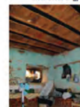
Elemente origjinale në përdhese - Tavani dhe Dera