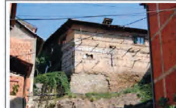
Pamje Jug-Perëndimore e ndërtesës