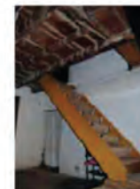
Elementet origjinale në enterier