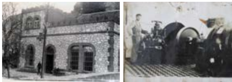
Mundësuar nga Nora Arapi Krasniqi

Vlerat artistike - Është një nga ndërtesat e para industriale me trajtim të veçantë arkitekturor, që përfaqëson nisjen e arkitekturës moderne dhe ndikimin evropian në arkitekturën e Prizrenit. Vendndodhja, forma, përzgjedhja e materialeve të ndërtimit krijojnë vlerat artistike të kësaj ndërtese.