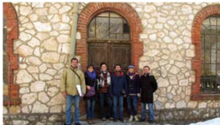
Mundësuar nga Nora Arapi Krasniqi

Vlerat shkencore - Vetëm ndërtesa përbën një provë të shkëlqyer të prodhimit të energjisë elektrike duke përdorur fuqinë e ujit në fillim të shekullit të 20-të.