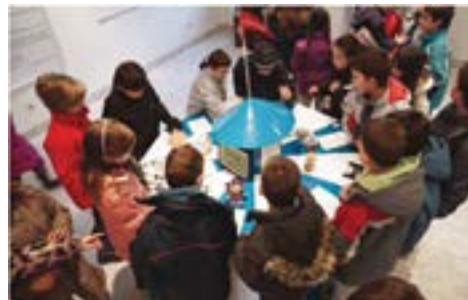
Mundësuar nga Višnja Kisić

Thesari im sekret përfshinte qytetarë nga Serbia Jugperëndimore në një proces mbledhjeje, interpretimi dhe paraqitjeje të trashëgimisë nga rajoni, duke krijuar një koleksion online të trashëgimisë së tyre personale. Projekti kishte të bënte me seminare me fëmijë të shkollave fillore dhe të mesme, interviste me të moshuar, një koleksion/bazë të dhënash online në adresën www.vasar-basine.com si dhe ekspozita me muzetë partnerë së bashku me komunitetet lokale.