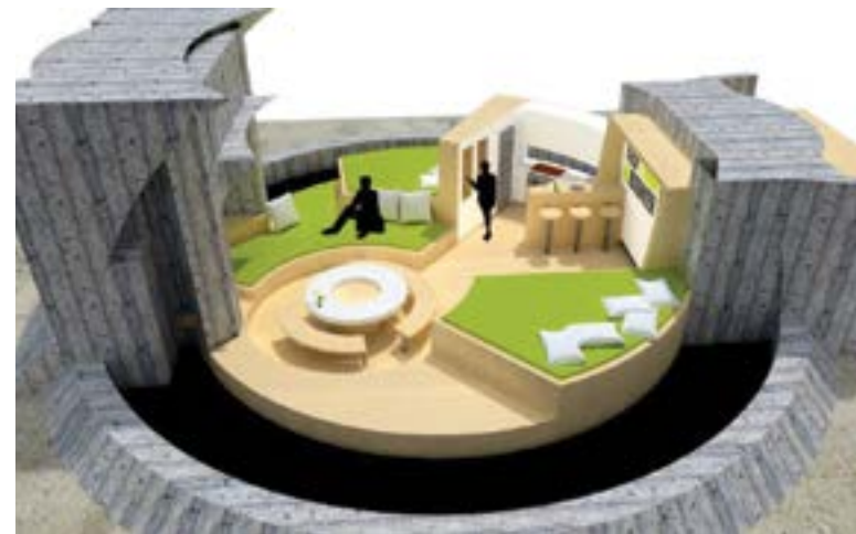
Mundësuar nga Endrit Marku

Bunkerët përfaqësojnë ende një temë të nxehët në Shqipëri, si dëshmi të një të shkuare jo dhe aq të bukur për t'u quajtur histori. Në vitet 1970-të dhe 1980-të, mijëra bunkerë të llojeve të ndryshme u vendosën për arsye mbrojtëse nëpër gjithë vendin.