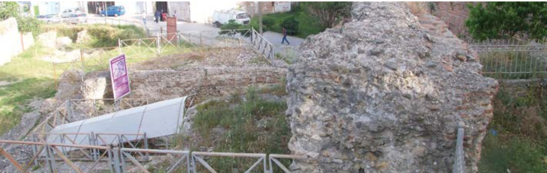
Mundësuar nga ADCT

vuan nga lënia pas dore. Me propozim të Shoqatës për Zhvillimin e Turizmit Kulturor (SHZHTK) në Shqipëri, amfiteatri romak i Durrësit është renditur si një nga 7 monumentet më të rrezikuara të Evropës, një veprim ky që synon jo vetëm shpëtimin e monumentit por edhe përmirësimin e tij, si rrjedhojë, rigjallërimin e gjithë zonës arkeologjike dhe historike, duke krijuar më tepër mundësi për zhvillimin e turizmit kulturor dhe duke nxjerrë në pah qytetin si një destinacion potencial turistik.