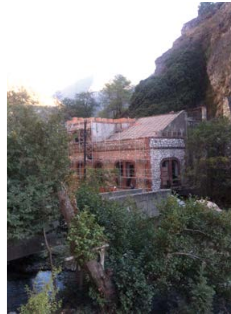
Mundësuar nga Nora Arapi Krasniqi

Një vend trashëgimie që pret të rifutet në jetën e njerëzve.