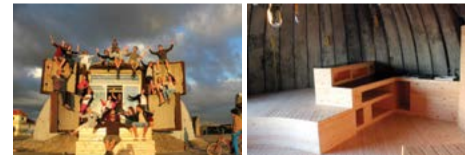
Mundësuar nga Endrit Marku

Studentët ishin në gjendje të konceptonin, skiconin dhe ndërtonin vetë një dhomë hoteli plotësisht funksionale brenda bunkerit të vjetër. Patën sukses në përpjekjet e tyre për të krijuar diçka të re dhe origjinale brenda një objekti ekzistues të fortë e të vështirë. Kurse synimi tjetër i projektit, ai i përpjekjes për të paraqitur publikisht tërheqjen e bunkerëve duke përhapur ide që mund të krijojnë terren për një të ardhme më të sigurt për këto specie ndërtimi endemike shqiptare, ishte po aq i suksesshëm. Njerëzit, shqiptarë e të huaj, por edhe mediat, shfaqën interes për këtë projekt të përmbushur nga një grup prej 25 shqiptarësh dhe gjermanësh arkitektësh dhe dizenjuesish të sotëm e të ardhshëm.