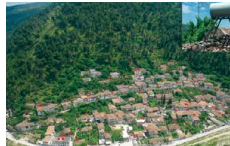
Mundësuar nga Ekphrasis Studio

të krijohet një trashëgimi e re kulturore dhe të vendoset një farë marrëdhënieje vizuale. Shembuj mund të gjenden në gjithë botën, nga Sidnej, Australi, i cili tani ka një regjistër bashkiak të muraleve për të mbrojtur artin ikonik të mureve, deri në Nju Jork ku depozitat funksionale të ujit janë kthyer në një simbol dominues kulturor të qytetit dhe janë krijuar ligje të reja lidhur