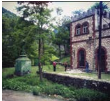
Mundësuar nga Nora Arapi Krasniqi

Hidrocentrali Prizrenasja përfaqëson një ndërtesë të rëndësishme në historinë e zhvillimit të energjisë elektrike në Kosovë.