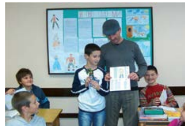
Mundësuar nga Višnja Kisić

njerëzimit që jetojnë në këtë rajon - vlerat e tyre, mendimet, kujtimet, arsimin, marrëdhënien mes tradicionales dhe modernes, nostalgjinë, emocionet dhe monumentet historike kyçe në jetët e individëve dhe bashkësive - në mënyrë shumë më të gjallë nga sa e kishin bërë më parë muzetë partnerë. Në këtë proces, muzetë nuk ishin më zëri autoritar që asnjëherë zërin individual, të brendshëm dhe emocional - ata luajtën rolin e ndërmjetësit të kujtimeve, duke hedhur dritë dhe kanalizuar zërat e e dytë duhet plotësuar nga anëtarët e moshuar të bashkësisë që plotësonin propozimet e fëmijëve, por edhe propozonin thesaret e tyre të fshehta.