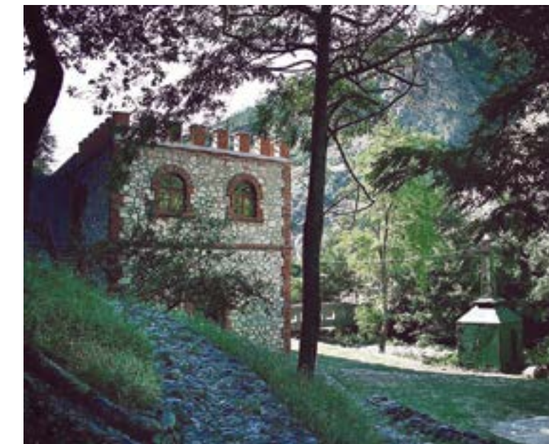
Mundësuar nga Nora Arapi Krasniqi

Hidrocentrali Prizrenasja ndodhet në pjesën lindore të Prizrenit dhe paraqet një nga hidrocentralet e para të ndërtuara në Kosovë. U ndërtua në vitin 1929 sipas një projekti të skicuar nga një zyrë austriake dhe i dha energji Prizrenit për 44 vjet me radhë. Me mbërritjen në qytet të energjisë elektrike, jeta kulturore dhe ekonomike u gjallërua. Në vitin 1929 u hap kinemaja e parë, u zhvilluan zeje të reja si: prodhimi i prizave prej druri, zileve të dyerve dhe transformatorëve të vegjël. Hidrocentrali furnizonte me energji institucionet publike, banesat e njerëzve të pasur, mullinjtë dhe institucionet tregtare. Për shkak të mungesës së kapacitetit dhe pajisjeve të vjetruara, hidrocentrali pushoi së funksionuari në vitin 1973.